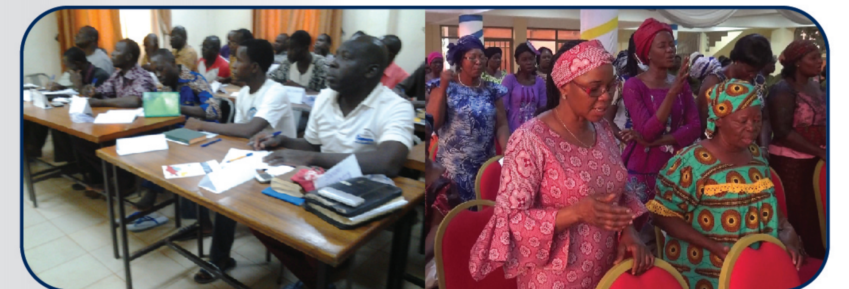
Formation & Prière

C'est l'entretien de la moisson par la constitution de Groupes de Formation de Disciples qui se réunissent régulièrement pour l'étude de la Bible à travers SFEM. Le but visé est un mouvement de disciples multiplicateurs.